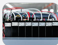
Sistema de pressão negativa com controle digital