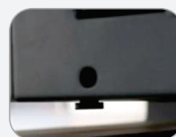
Sistema automático de medição de espessura