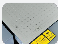
Mesa de vácuo com pino de registro